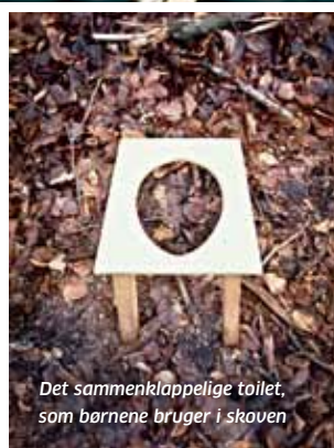
Det sammenklappelige toilet, som børnene bruger i skoven

Når et af børnene skal på toilettet, tager pædagogerne et lille toiletsæde frem med fire ben, der kan klappes ud. Hvis det er mere end en tissetår, graver de voksne et lille hul,